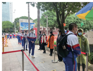
共同关注学生进校晨午检情况