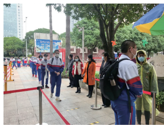
共同关注学生进校晨午检情况